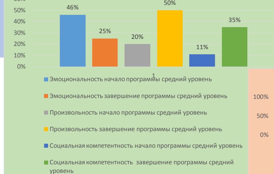
Сравнительный анализ среднего уровня