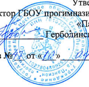
График выдачи продуктовых наборов, формируемых за счёт средств бюджета Санкт-Петербурга, для учащихся ГБОУ прогимназия №698 Московского района Санкт-Петербурга «Пансион»